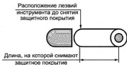
Рисунок 1 — Длина волокна, на которой снимают защитное покрытие

Для проведения измерения следует обеспечить, чтобы длина отрезка волокна была более установленной длины, на которой должно быть снято покрытие. Полная длина отрезка состоит из длины волокна, необходимого для его крепления на натяжном барабане, волокна между натяжным барабаном и инструментом для снятия защитного покрытия (рисунок 2) и длины волокна, которая выступает из инструмента для снятия защитного покрытия (рисунок 1). Полная длина отрезка должна быть достаточной, чтобы соответствовать этим составляющим. Результаты испытания не зависят от полной длины образца. Частично результаты испытания зависят от длины волокна, на которой снимают защитное покрытие.