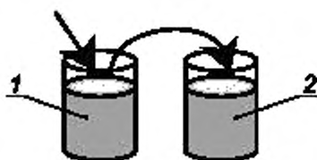
1 — стакан с пробой моторного топлива (промывка); 2 — стакан с пробой моторного топлива (измерение)

5.2.1 Измерительный датчик анализатора устанавливают поочередно в стаканы (рисунок 1), предварительно наполнив их измеряемой пробой.