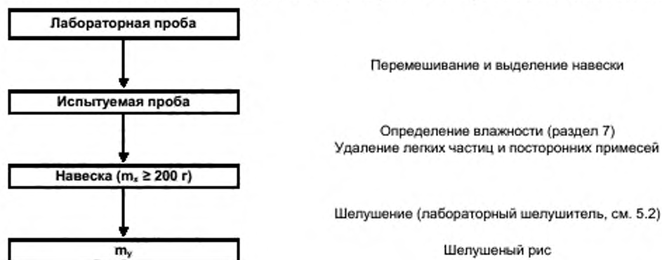
Схема А.2 – Исходная проба – нешелушенный и пропаренный нешелушенный рис: выход шелушенного риса, шлифованного риса и целого шлифованного риса

Схема А.1 – Исходная проба – нешелушенный или пропаренный нешелушенный рис: выход шелушенного риса