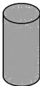
Рисунок 2 — Агломерированная корковая пробка

5.2 Агломерированные корковые пробки — это пробки, корпус которых целиком состоит из агломерата (рисунок 2). Пробки этого типа не следует использовать для игристых вин.