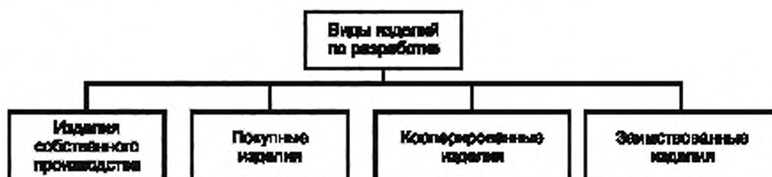
Рисунок А.3 — Виды изделий по разработке

А.3 Виды и структура изделий по разработке приведены на рисунке А.3.