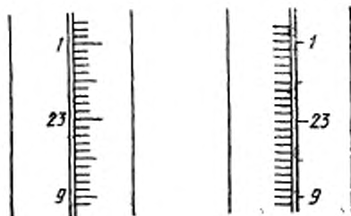
Рисунок 2 — Различные способы градуировки и оцифровки

8.5 Штрихи должны быть расположены так, чтобы эмалевая полоска капилляра представляла собой фон для цифр, шкалы и столбика ртути, когда последний виден над левыми или правыми концами коротких штрихов в соответствии с рисунком 2.